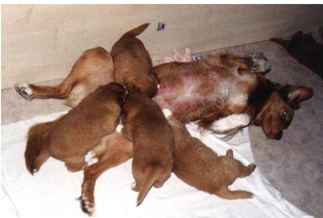
Die Bar ist geöffnet