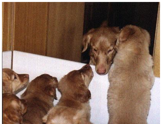
Die 'gute Nacht-Geschichte'