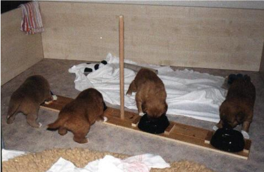
Wir kriegen nie genug