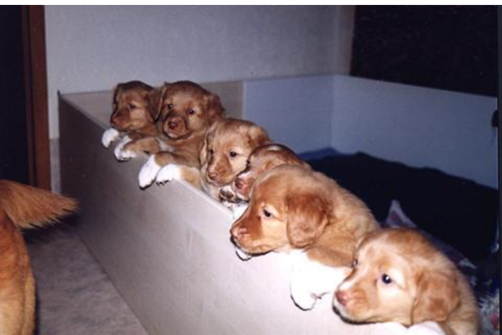
Was gibt's denn da zu sehen?